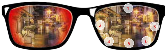
Konvenční jednoohnisková čočka